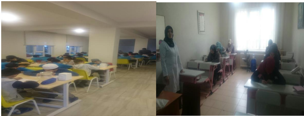
Şekil 1. Gökmeydan Kız Kur'an Kursu Şekil 2: Merkez Bölge Erkek Yatılı Kur'an Kursu

Elde edilen formlar incelendikten sonra 12 formun eksik veya yanlış doldurulduğu görülmüş, analizler 329 anket formunun verileri dikkate alınarak